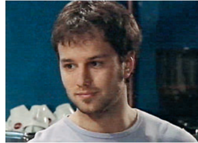
Deniz ist sich über die Gefühle zu Sandra im Unklaren

3. Julia ist erschüttert, dass Nico sich aus lauter Liebe von ihr trennen will. Es fällt ihr schwer, seinen Entschluss nicht auf sich zu beziehen. Verena ist über Nicos Aktion empört und stellt ihn zur Rede, nur um zu begreifen, dass es ihm wirklich um Julias Wohl geht. Die CD, die sie für ihn angefertigt hat, lässt Nico nahezu zusammenbrechen.