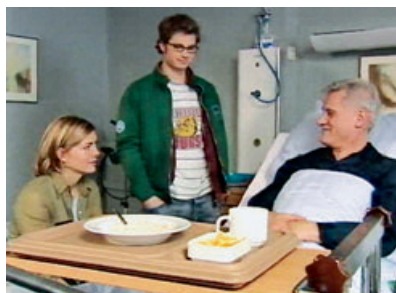
Clemens bekommt Besuch von Tim

1. Clemens unterdrückt seine Besorgnis bezüglich der Konsequenzen des Herzinfarktes, um seine Familie nicht zu beunruhigen. Als Dr. Limbach ihn darüber aufklärt, dass seiner Genesung nichts mehr im Wege steht, glaubt Clemens aber, gleich wieder in sein altes Leben einsteigen zu können. Er hat jedoch nicht mit Dr. Limbachs Hartnäckigkeit gerechnet.