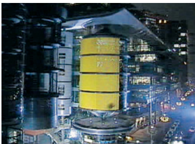
Außeneinstellung des Gebäudes, in dem sich das Restaurant »Fasan« befinden soll, an einem Originalschauplatz.

Für eine Soap werden ganz bestimmte filmische Mittel verwandt. Damit nicht der Eindruck entsteht, die Serie spiele im »luftleeren« Raum, werden Außenaufnahmen mit Einstellungen im Studio kombiniert. Ein Beispiel hierfür ist das Restaurant »Fasan«.