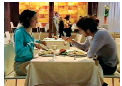
Das Innere des Restaurants steht ebenfalls in einem Studio.