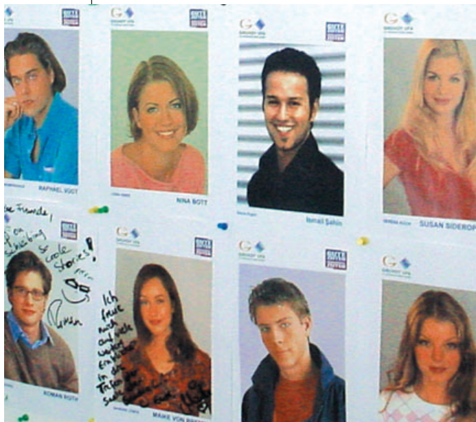
Übersichtswand mit den Stars der Serie GZSZ in den Redaktionsräumen

CLEMENS RICHTER TIM BÖCKING DR. PETRA LIMBACH NICO WEIMERSHAUS JULIA BLUM CORR MORENO ANTONIA HANNES BACHMANN DENIZ ERGÜN SANDRA LEMKE VERENA KOCH BEN BACHMANN ALIA ÖNDAR GERD PETRA MOCCA GÄSTE O. T.* FASAN GÄSTE O. T. PATIENTEN O. T. PFLEGEPERSONAL O. T.