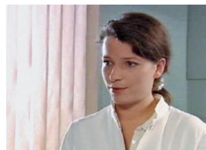
Dr. Limbach will nur das Beste für ihre Patienten

2. Sandra ist durch Deniz' Zurückweisung verletzt und ärgert sich, das Angebot überhaupt gemacht zu haben. Deniz selbst weiß auch nicht, wie er mit seinen Gefühlen umgehen soll und macht dadurch alles noch viel schlimmer. Erst auf Alias subtiles Drängen hin wird Deniz bewusst, dass er ernste Gefühle für Sandra hat. Sandra aber glaubt, Alia habe ihr Vertrauen missbraucht.