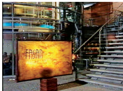
Der Eingang des Restaurants im Studio – Straßengeräusche im Hintergrund.

Kameraeinstellung: Totale (extreme long shot)