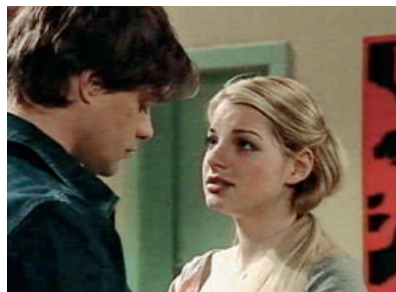
Julia kann Nicos Trennungsentschluss nicht verstehen

3. Julia ist erschüttert, dass Nico sich aus lauter Liebe von ihr trennen will. Es fällt ihr schwer, seinen Entschluss nicht auf sich zu beziehen. Verena ist über Nicos Aktion empört und stellt ihn zur Rede, nur um zu begreifen, dass es ihm wirklich um Julias Wohl geht. Die CD, die sie für ihn angefertigt hat, lässt Nico nahezu zusammenbrechen.